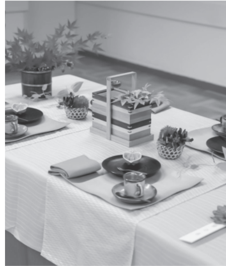
【協会賞】 「風さやか 信州のお小屋（おこびれ）」 2022年

州のお小屋（おこびれ）」のテーブルコーディネートでコンテスト最優秀賞（協会賞）を受賞しました。料理だけでなく、器や箸などにおいても安心安全でその土地の焼き物や漆などテーブルコーディネートを通して地域に根差した食文化として継承していきたいと考えています。